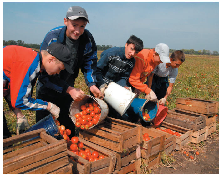
Теперь овощи можно будет хранить до нового урожая.